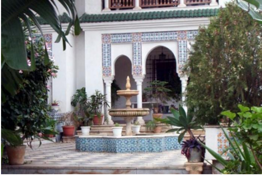
جانب من فيلا عبد اللطيف بعد ترميمها سنة 2006

شاعت الأقدار أن تكون هذه الدار المهد الأول للممارسات التشكيلية في الجزائر كان ذلك على يد الفرنسيين " أنشأ الفرنسيون مدرسة الفنون الجميلة ثم فتحوا فيلا عبد اللطيف أمام الفنانين الفرنسيين، أما المدرسة فقد فتحوها سنة 1881 في مدينة الجزائر" 12 .